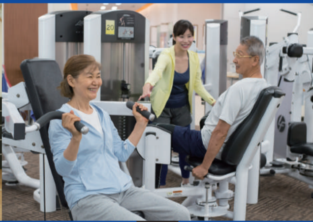
中高齢者・健康づくり教室