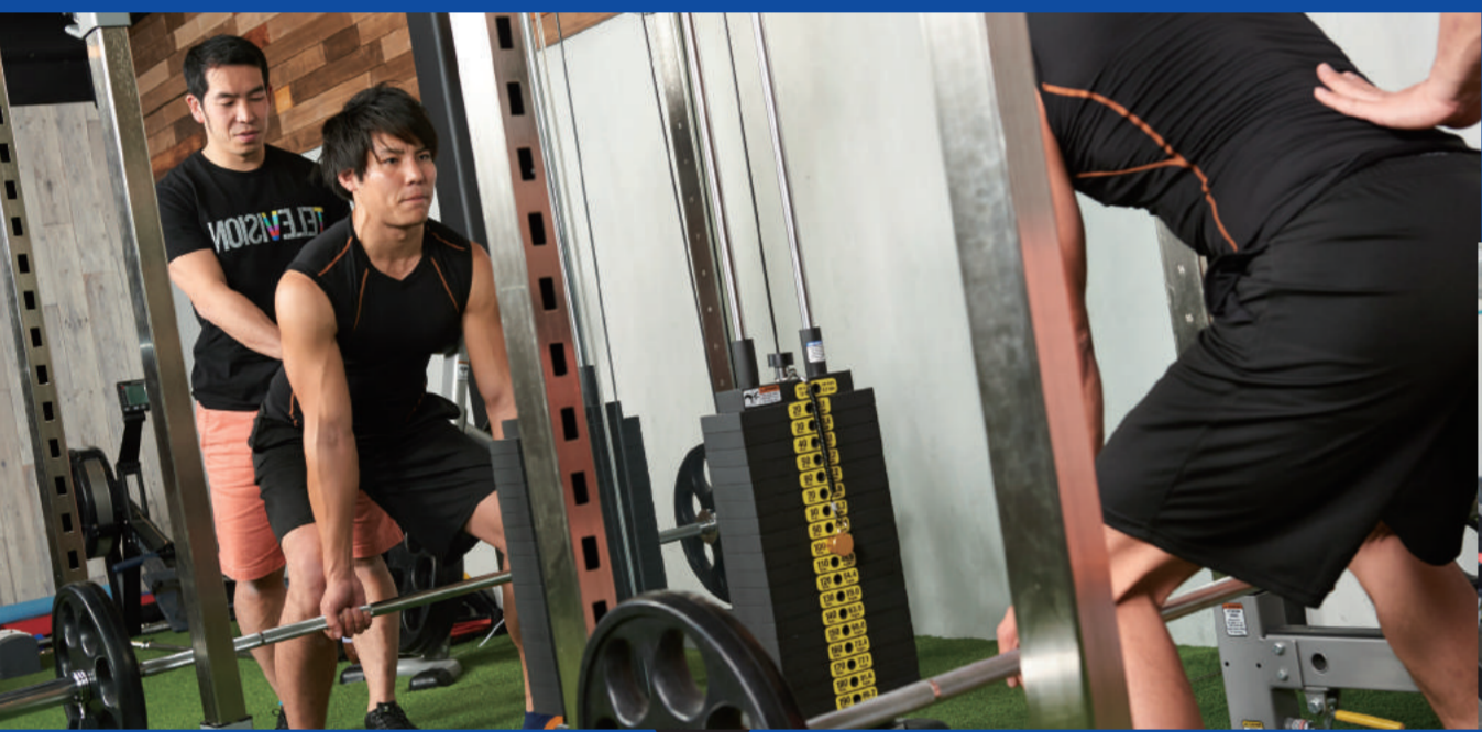
プロ・社会人チーム・アスリート

JATI-ATIとは、トップアスリートの体力強化から 一般人の健康・体力増進まで幅広い分野で活躍できる専門資格です。