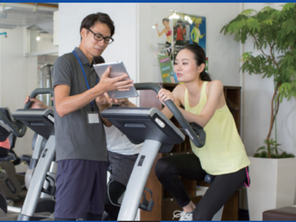
フィットネスクラブ・パーソナルトレーニング