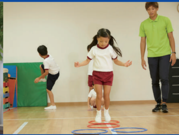
子ども・部活・地域スポーツ