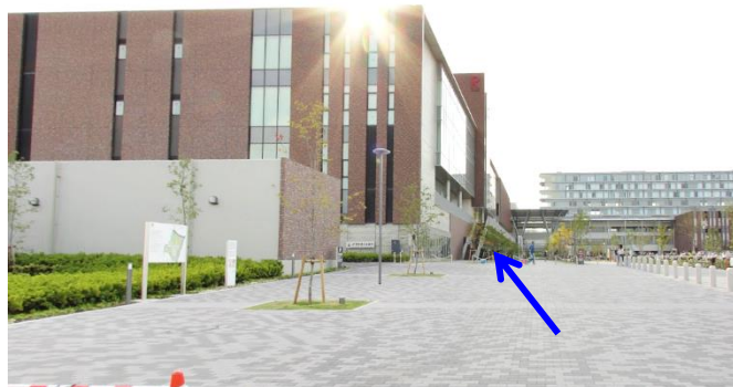
東エントランス (中条門) からの B 棟外観