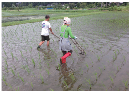
アスリートがトレーニングを兼ねて行う農作業は高齢化の進む地方農家には貴重な労働力(明日里人ファーム)