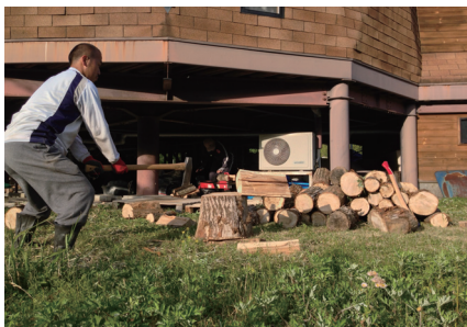
トレーニングと作業を兼ねたまき割り(明日里人ファーム)