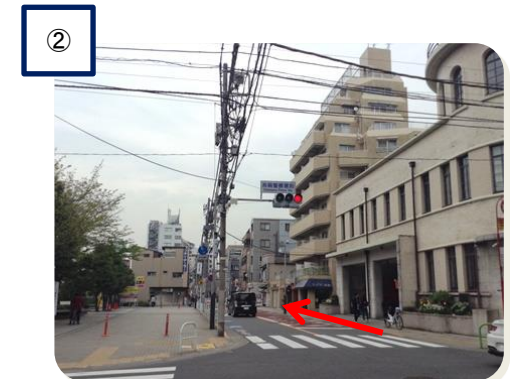
高輪警察署前交差点 (直進約300m)