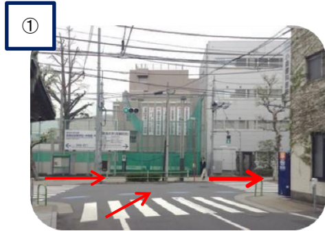
白金高輪駅 (国道1号線) 方面