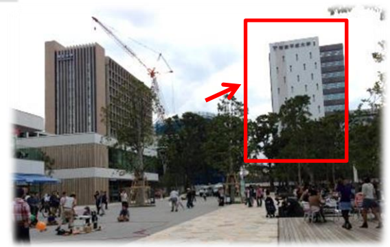
右側が帝京平成大学 左手が明治大学

※大学のセキュリティの都合上、受付開始時刻までは入館できません。予めご了承ください。 会場入館時に同封の受講票が必要です。お忘れにならないよう、ご注意ください。